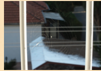
* בתמונה מצולמים קורי עכביש

- איזה סוג של חכמה או ידע בא לידי ביטוי בכל אחת מהתמונות? חכמה - כישרון יסודי, אשר ניתן כמתת-אל: "אשר חלק מחכמתו לבשר ודם". חכמה קשורה ליכולת לקלוט עובדות מבחוץ, לשמוע וללמוד מאחרים. בינה - כישרון לחשוב ולהסיק מסקנות. להבחין בהבדלים בין עובדות שונות, היכולת להבין דבר מתוך דבר והיכולת ליצור היקש בין הנתונים השונים. דעת - יכולת להכיר דבר מקרוב באמצעות החושים. לראות תמונה כוללת של פרטים רבים ולהיות "מחובר" למציאות.